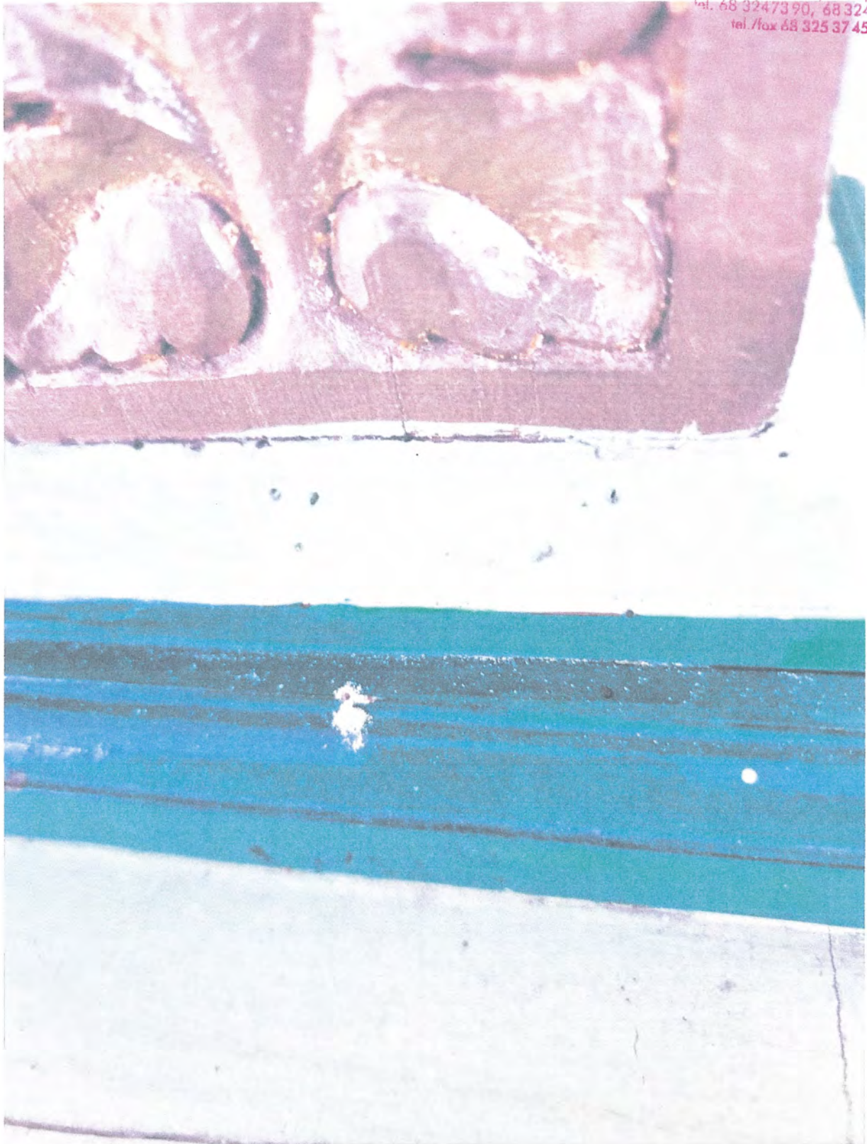
Polichromie są zabrudzone, poprzecierane, plamiste. Wykonane niestarannie, w szczelinach i zakamarkach widać zalegający brud.